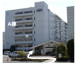
②安田倉庫守衛を通過付近