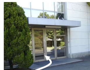
③3号棟入口 2F 営業本部