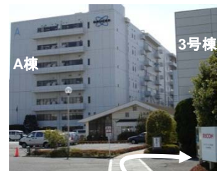
②安田倉庫守衛を通過