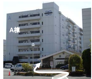
②安田倉庫守衛を通過付近