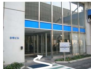
④B棟入口 6F アプリケーション・サポートセンター (デモルーム)